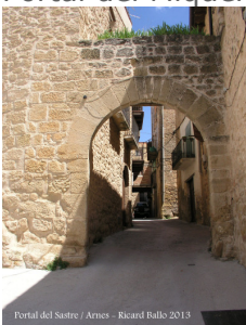
Portal del Sastre / Arnes - Ricard Ballo 2013

Portal del Miquelet, del Sastre, del Portalet i de la Sardinera.