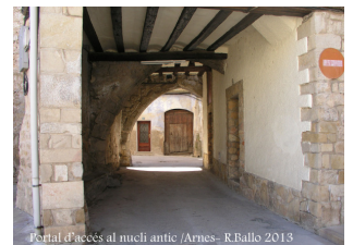
Portal d'accés al nucli antic / Arnes - R.Ballo 2013