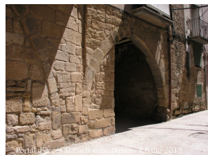
Portal d'accés al nucli antic / Arnes - R.Ballo 2013