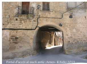
Portal d'accés al nucli antic / Arnes - R.Ballo 2013